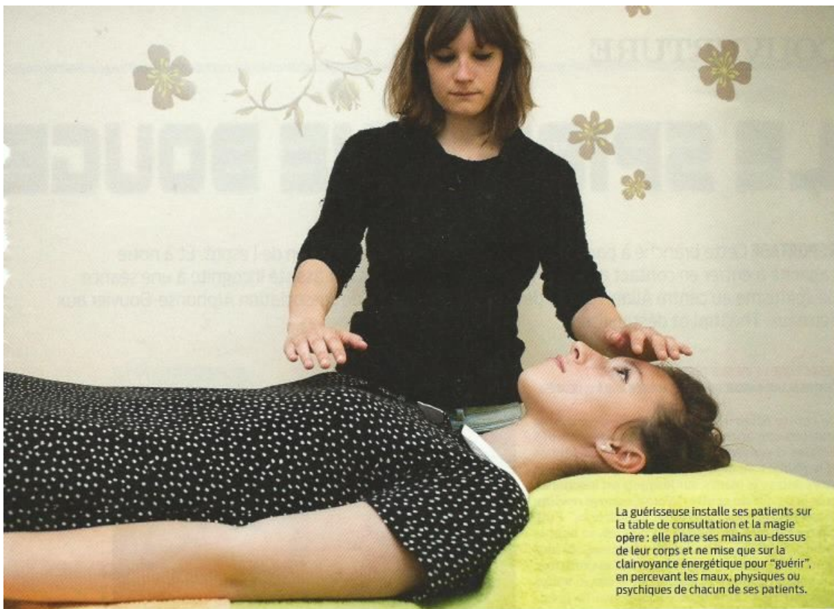
La guérisseuse installe ses patients sur la table de consultation et la magie opère : elle place ses mains au-dessus de leur corps et ne mise que sur la clairvoyance énergétique pour "guérir", en percevant les maux, physiques ou psychiques de chacun de ses patients.